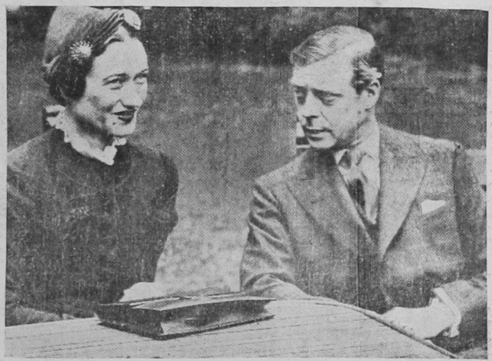
El Duque de Windsor aparece en esta reciente fotografía en compañía de su prometida, la señora Wallis Warfield, con quien se reunió después de muchos meses de separación. Esta fotografía fue tomada cuando se anunció que el matrimonio sería el 3 de junio.